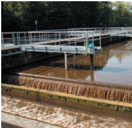
Biologisches Reinigungsbecken der Kläranlage Schönau

So gehören Feststoffe wie Wattestäbchen, Wegwerfwindeln, Kondome, Slip-einlagen, Verpackungen, Textilien, Katzenstreu, Zigarettenstummel nicht in die Kanalisation. Diese Dinge gehören in die gebührenpflichtigen Kehrichtsäcke.