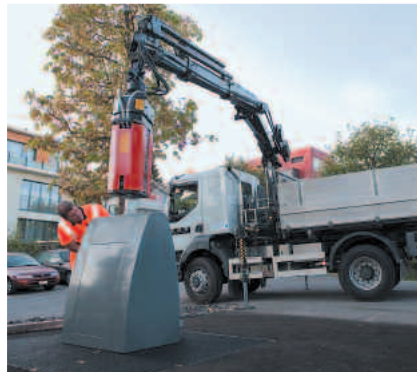
Unterflursammelstelle Menzingen: Leeren des Unterflurcontainers