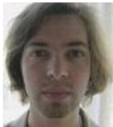
Bieri Gaudens Klavier/Keyboard/ Korrepetition